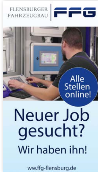
FLENSBURGER FAHRZEUGBAU | FFG