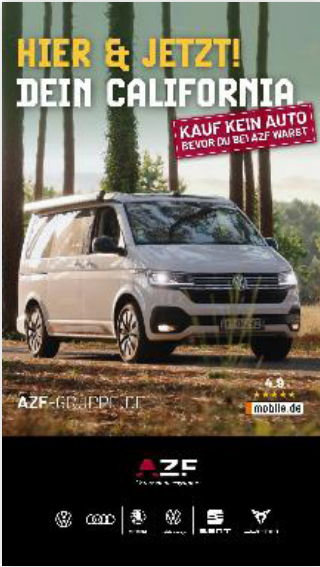
AUDI ZENTRIM FLENSBURG VERTRIEBS GMBH