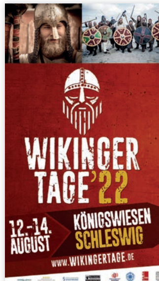
WIKINGER TAGE SCHLESWIG