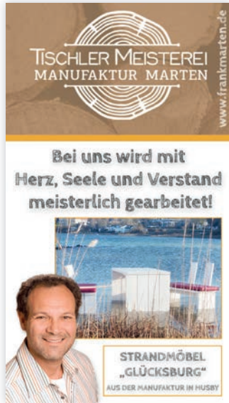
TISCHLER MEISTEREI MANUFAKTUR MARTEN